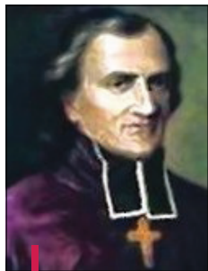
Les élus ont sollicité une subvention pour la réalisation du buste de Forbin Janson à la fontaine du même nom.

À l'unanimité, le conseil municipal décide d'incorporer dans